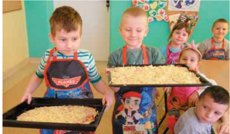
DUMNE PRZEDSZKOLAKI PREZENTUJĄ SWOJE PIZZE.