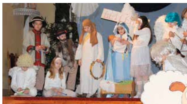
UCZNIOWIE Z KÓŁKA TEATRALNEGO POCZULI SMAK SUKCESU