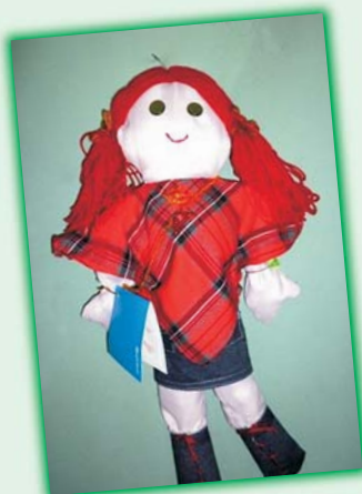
„Ania” (nr 12)