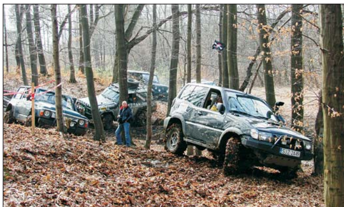
Na trasie „Wojnarówki”

10 marca na zamarskim torze offroadowym „Wojnarówka”, przygotowanym przez „Landstar”, odbył się offroadowy Dzień Kobiet, którego organizatorem była „Ekipa Śląska” portalu www.4x4off.pl .