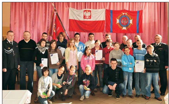
Uczestnicy finału gminnego turnieju z jego organizatorami

3 marca w sali remizy w Zamarskach przeprowadzono gminne eliminacje Ogólnopolskiego Turnieju Wiedzy Pożarniczej „Młodzież zapobiega pożarom”. Wzięło w nich udział 19 uczestników.