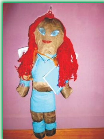
„Bloom” (nr 38)