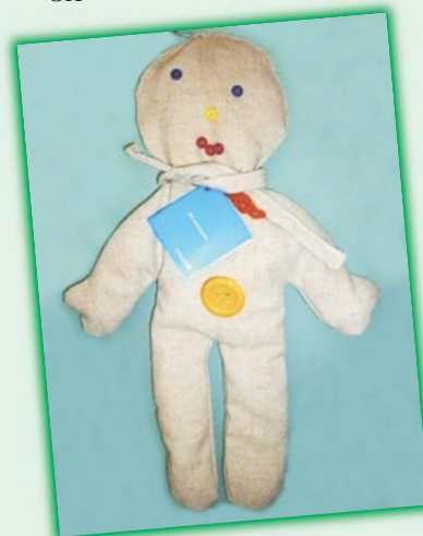
„Zuzia” (nr 16)