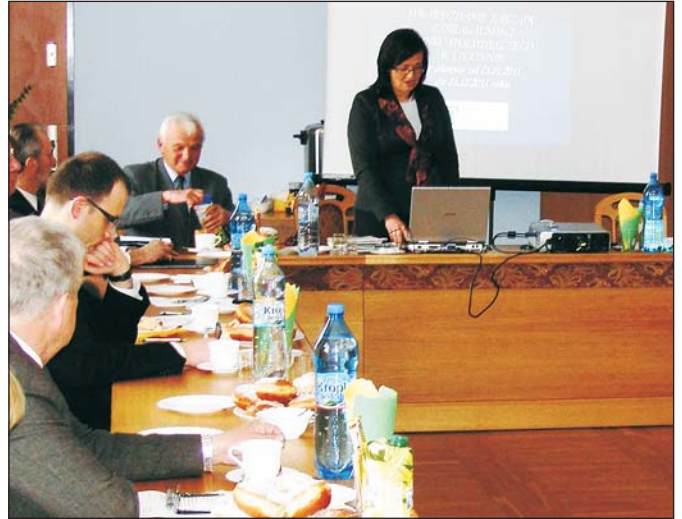
Spotkanie w sali sesyjnej UG Hażlach