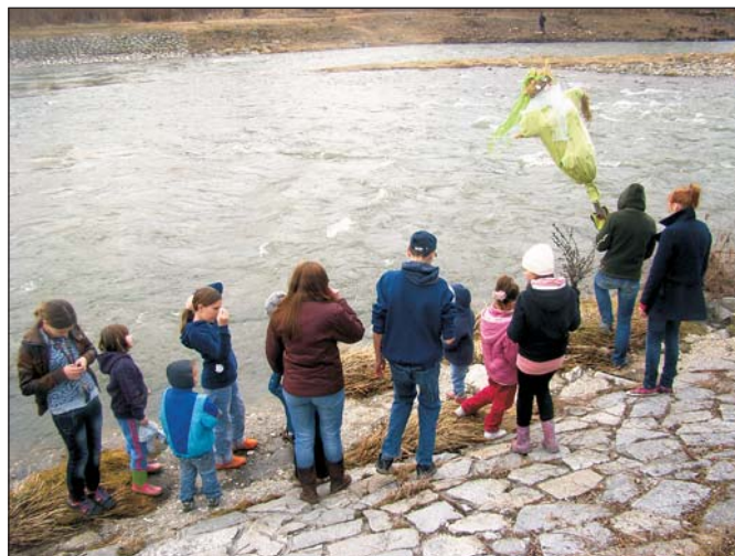
Z Marzanną nad brzegiem Olzy

Wiosna to początek nowego cyklu życia, to pożegnanie długiej zimy, to czas kiedy przyroda budzi się do życia. Obrządkiem, który ma przywołać wiosnę, jest topienie Marzanny. Jej kukłę wykonuje się z wiechcia słomy, ubiera w białą suknię, przyozdabia wstążkami, koralikami i kwiatami. Następnie zanoszą ją do pobliskiej rzeki, podpala i wrzuca do wody, co ma symbolizować odejście zimy a nadejście upragnionej wiosny.