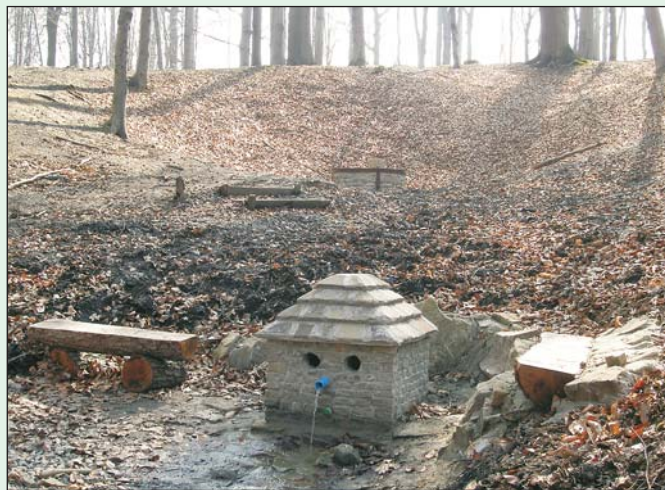
Wykonane z piaskowca nowe ujęcie wody

wodę, zaklinając się że jest ona z „Gorgonowego” źródła”.