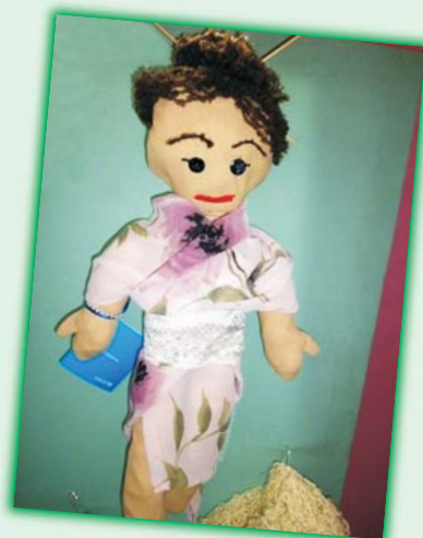
„Mulan” (nr 9)