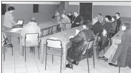
Rolnicy w sali hażlaskiego GOK

Aby taką pomoc otrzymać, wniosek o płatności rolnośrodowiskowe oraz dodatkowe załączniki muszą być opracowane przy pomocy doradcy rolnośrodowiskowego, który będzie opiekunem rolnika w dalszej realizacji wniosku. Wnioski składane są w terminach od 15 marca do 15 maja. Szczegółowe informacje na temat dodatkowego wsparcia z tytułu realizacji przedsięwzięć rolnośrodowiskowych i poprawy dobrostanu zwierząt można uzyskać na stronach internetowych: www.minrol.gov.pl , www.arima.gov.pl lub bezpośrednio w PZDR w Cieszynie.