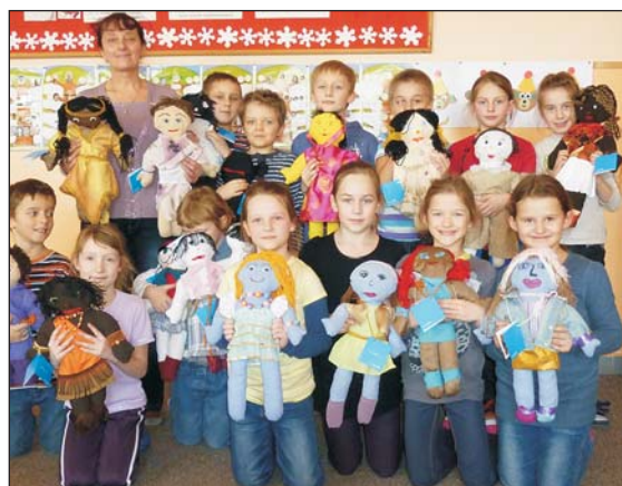
Uczniowie ze swoimi lalkami

Wszystkie wykonane przez naszą młodzież „magiczne lalki” zostaną wkrótce zaprezentowane w specjalnej galerii zdjęć na stronie www.hazlach.pl . Do 11 marca można będzie oddawać na nie swoje głosy, wysyłając maila z numerem oraz imieniem wybranej lalki na specjalnie utworzony adres poczty elektronicznej: magicznalalka@hazlach.pl .