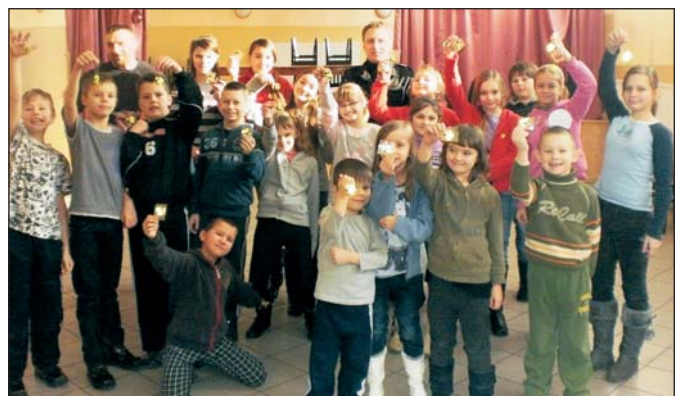
Uczestnicy zajęć z panami policjantami

Podopieczni zamarskiej Filii GOK także nie mogli narzekać na nudę. Jak podaje strona zamarski.blog.pl, „tegoroczne ferie zimowe u Świetlików były wypełnione licznymi, niezapomnianymi przeżyciami. Każdego dnia, począwszy od 30 stycznia, a kończąc 10 lutego, działo się coś niezwykłego i wyzwalało aktywność wśród uczestników. Na samym początku ferii - 31 stycznia - dzieci spotkały się z panami policjantami i ich pieskami. Głównym celem spotkania było wyposażenie dzieci w wiedzę o zasadach bezpieczeństwa podczas kontaktów z psami, poznanie właściwego zachowania w niebezpiecznych sytuacjach z nieznanymi oraz przypomnienie podstawowych zasad poruszania się po drodze”.