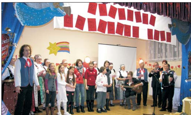
Wspólny śpiew na zakończenie