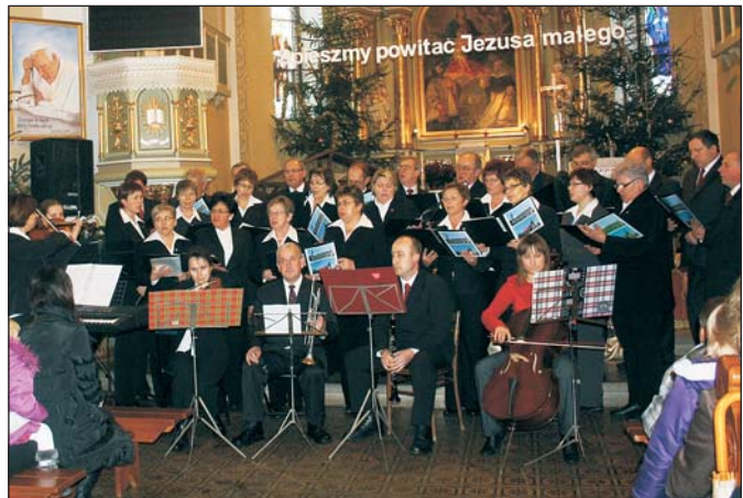
Koncert rozpoczął występ Chóru Ewangelickiego Hażlach - Zamarski