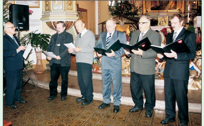
Męski Zespół Śpiewaczy OSP Zamarski