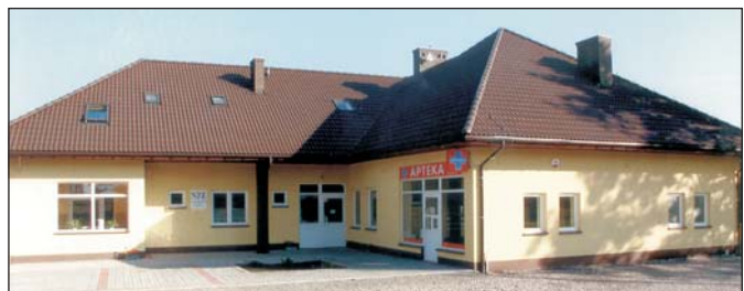
Nowy ośrodek zdrowia w Hażlachu

Stary ośrodek powstał w czynie społecznym, jeszcze w latach sześćdziesiątych, przy wielkim zaangażowaniu mieszkańców Hażlach. W miarę upływu lat przestał on jednak zapewniać odpowiedni poziom usług medycznych, wymagał remontu oraz sporych nakładów na ogrzewanie, stąd decyzja hażlaskiego NZOZ-u o przystąpieniu do budowy nowego obiektu, którego powierzchnia użytkowa wynosi ponad 200 metrów kwadratowych. (c.d. na str. 3)