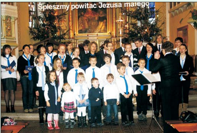
Ewangelicka Grupa „Gloria” z Hażlacha