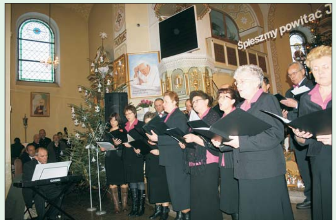
Chór Katolicki Parafii św. Bartłomieja Apostoła w Hażlachu