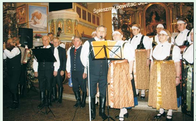
Zespół Regionalny „Nadolzianie” z Kaczyc