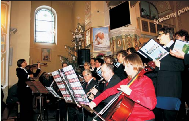
Chór Ewangelicki Hażlach - Zamarski