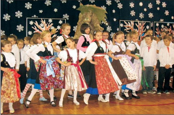
Specjalny występ dla dostojnych gości