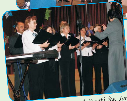
Chór Kameralny „Allegria” Parafii św. Jana Nepomucena w Pogwizdowie.