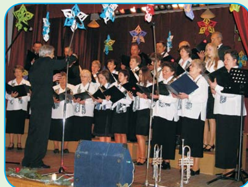
Chór Katolicki Parafii św. Bartłomieja Apostoła w Hażlachu.