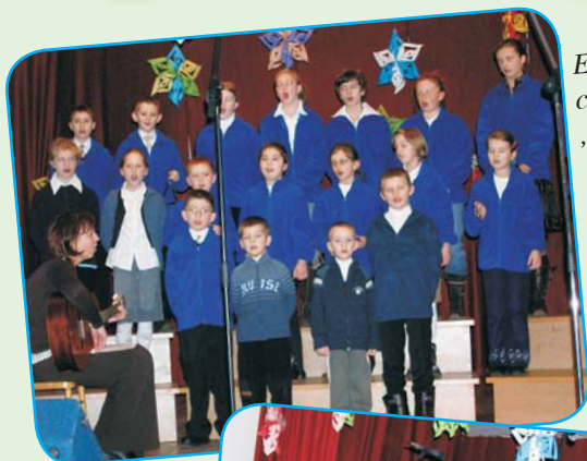
Ewangelicka Grupa „Gloria”.