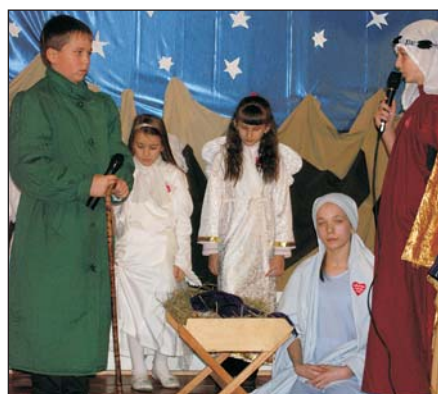
Jasełka w wykonaniu uczniów zamarskiej szkoły