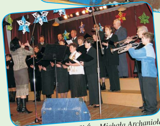
Chór Katolicki Parafii św. Michała Archanioła w Kończycach Wielkich.