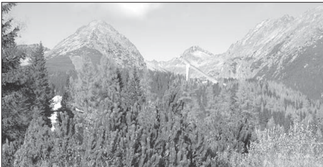
Krajobraz słowackich Tatr.

Ubiegły rok szkolny zakończyliśmy wspaniałą olimpiadą sportową w Bystrzycy. Po wakacjach stanęły przed nami nowe wyzwania – opracowanie nowych „tras” wspólnej podróży i ich realizacja. Takim ciekawym zadaniem był Międzynarodowy Festiwal Piosenki, który odbył się w rakowieckiej szkole. W dniach 25-28.10.2006 roku przedstawiciele obu kończyckich szkół udali się w daleką podróż na Słowację, na sam jej kraniec, blisko granicy z Ukrainą, gdzie w malowniczej okolicy leży Rakovec. Sama podróż, wspólna z czeskimi przyjaciółmi, dolina Popradu, wzdłuż Tatr słowackich, dostarczyła nam wielu niezapomnianych wrażeń. Jesień zaczarowała cały świat w piękne czerwienie i pomarańcze, na tle których słowackie zamki nabierały bajkowego uroku. Pstrykały flesze, szumiały kamery. Staraliśmy się utrwalić to ulotne piękno, aby pokazać te wszystkie cuda naszym kolegom po powrocie.