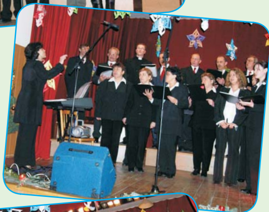
Chór Ewangelicki Hażlach-Zamarski.