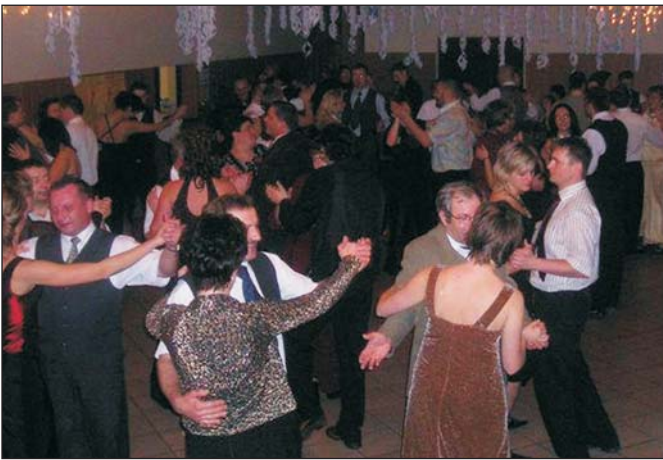
Bal zgromadził blisko sto osób.

Całkowity dochód z balu przeznaczony zostanie na zakup szafek do szatni naszego Gimnazjum.