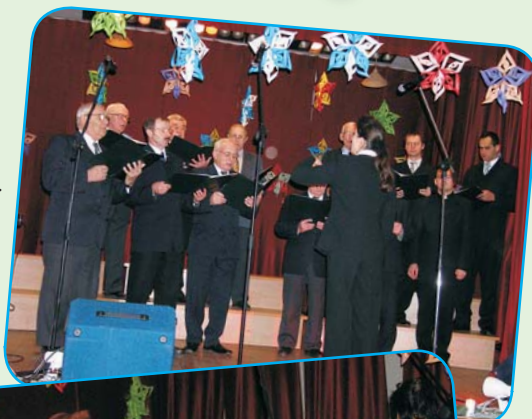
Męski Chór Ewangelicki z Zamarsk.