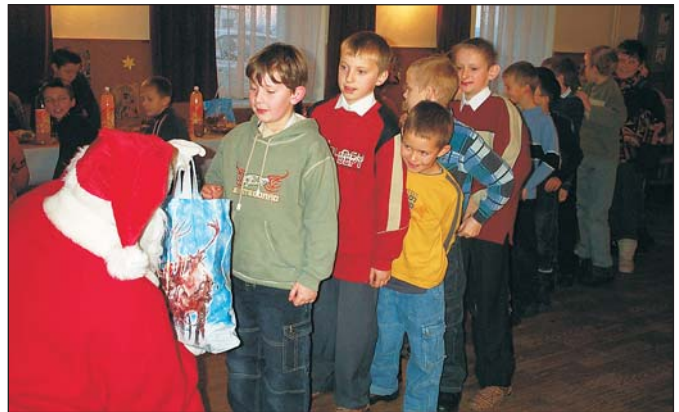
W kolejce po prezent od św. Mikołaja.